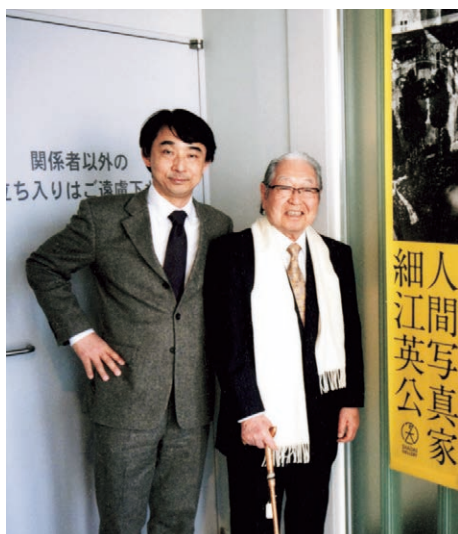
筆者と細江先生 写大ギャラリー前にて、2018年

東京工芸大学の学長として、そして教え子の一人として、細江英公先生に深く感謝するとともに、ここに謹んでご冥福をお祈りする。