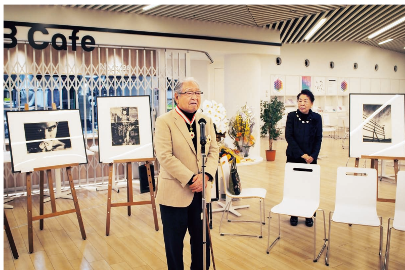
写大ギャラリー「人間写真家 細江英公」展オープニング 旭日重光章受章祝いの会、2018年1月22日@中野キャンパス